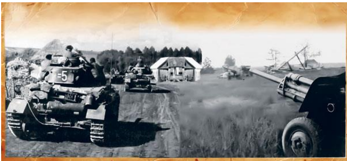
оллаж Андрея Седых

Третий. Опыт многих войн свидетельствует о том, что подвижность войск может часто замещать их многочисленность. Обладал ли в 1941–1942 годах вермахт таким преимуществом? К сожалению, да.