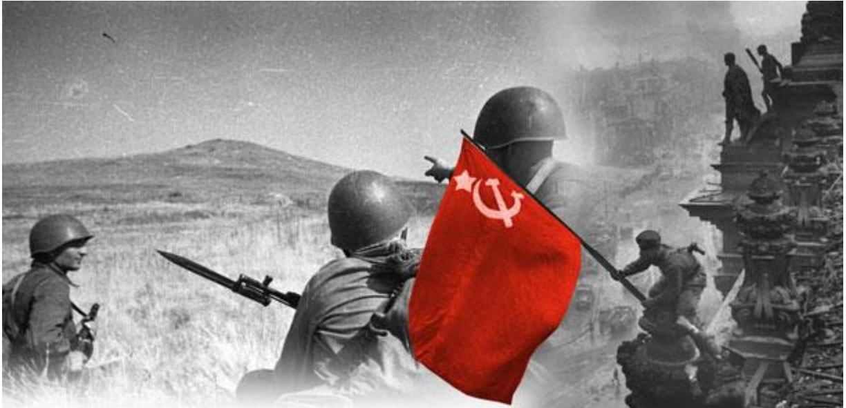
Коллаж Андрея Седых

Все эти провокационные акции предпринимаются не только отдельными хулиганами и отморозками, но и всецело поддерживаются определенными кругами в Евросоюзе. Когда мы все это видим сегодня в «цивилизованной» Европе, а в нашей стране затевается федотовско-карагановская «десталинизация», невольно задумываешься не только о том, за что воевали мы, ветераны Великой Отечественной, во имя чего гибли наши однополчане, но и почему все это стало возможным.