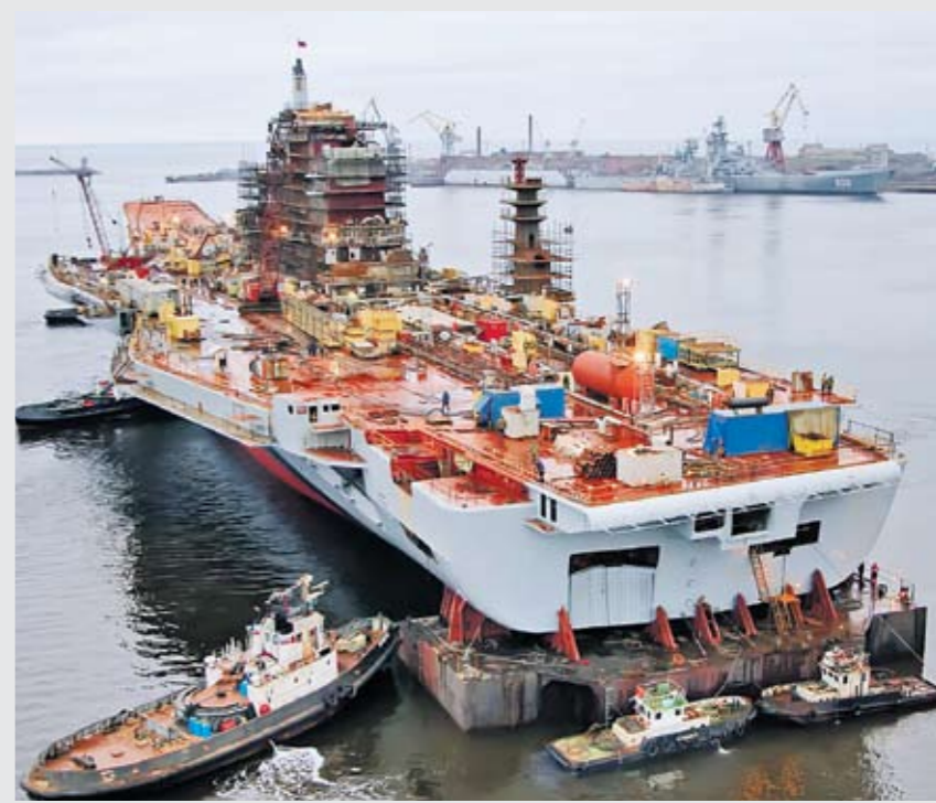
Справка «ВПК». ОАО «Производственное объединение «Северное машиностроительное предприятие» — крупнейший в России судостроительный комплекс, единственная верфь в стране, главная задача которой — поставка атомных подводных лодок ВМФ РФ. Завод с территорией более 300 гектаров объединяет в своей структуре свыше 100 подразделений. На Севмаше сегодня трудятся 26 тысяч человек. Средняя зарплата на предприятии — 23 тысячи рублей.