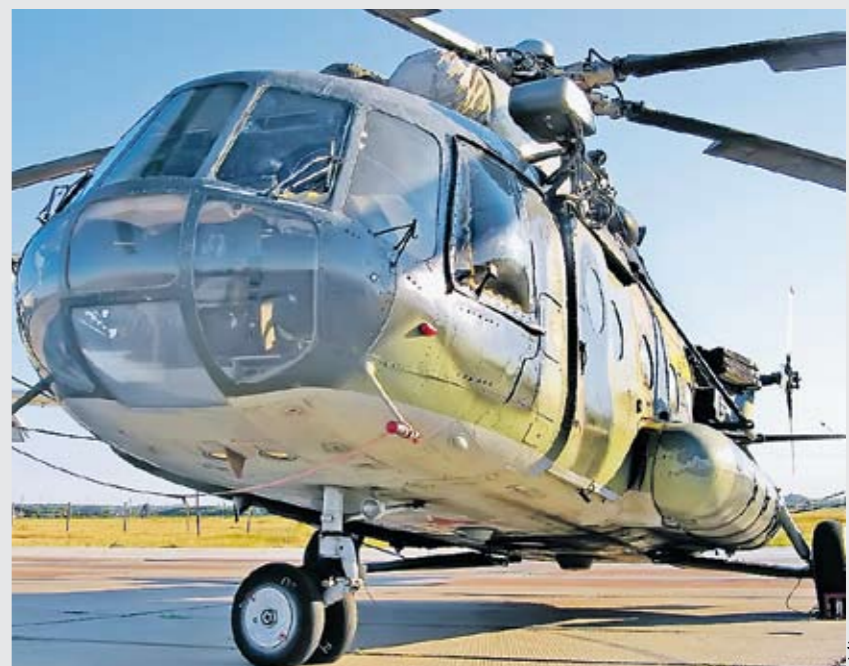
По сообщениям корреспондентов «ВПК», информгентств АРМС-ТАСС и Интерфакс-АВН