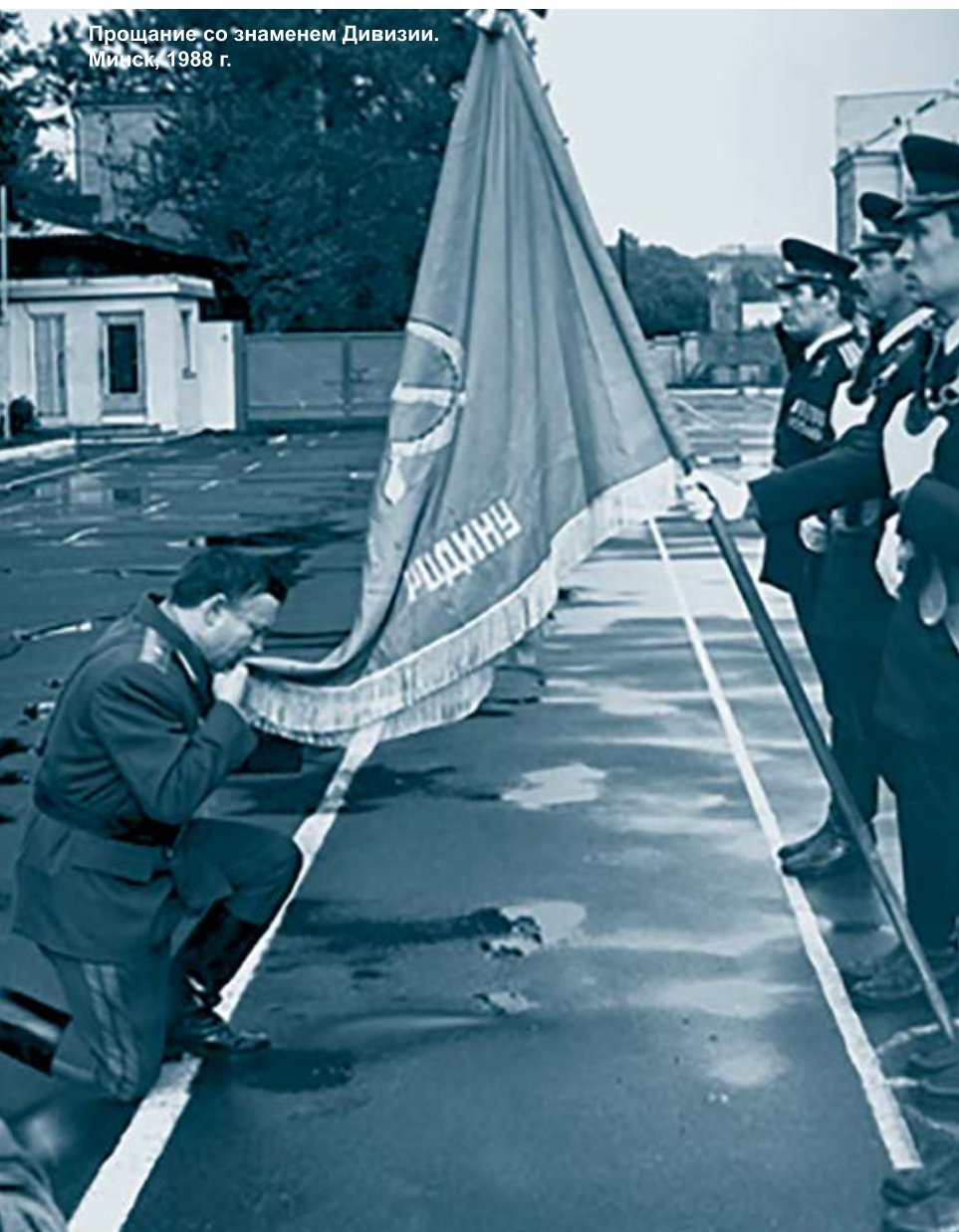
Прощание со знаменем Дивизии. Минск, 1988 г.

конюх, безграмотный, не имел ни одного класса образования. С первого до последнего дня он был наводчиком противотанкового ружья пехотного батальона 376-го стрелкового полка 220-й стрелковой дивизии, которая первой вошла в Минск. Он был четырежды ранен, подбил три немецких танка и уничтожил пятерых гитлеровцев. Был награжден орденом Красного Знамени. Рядовой конюх!