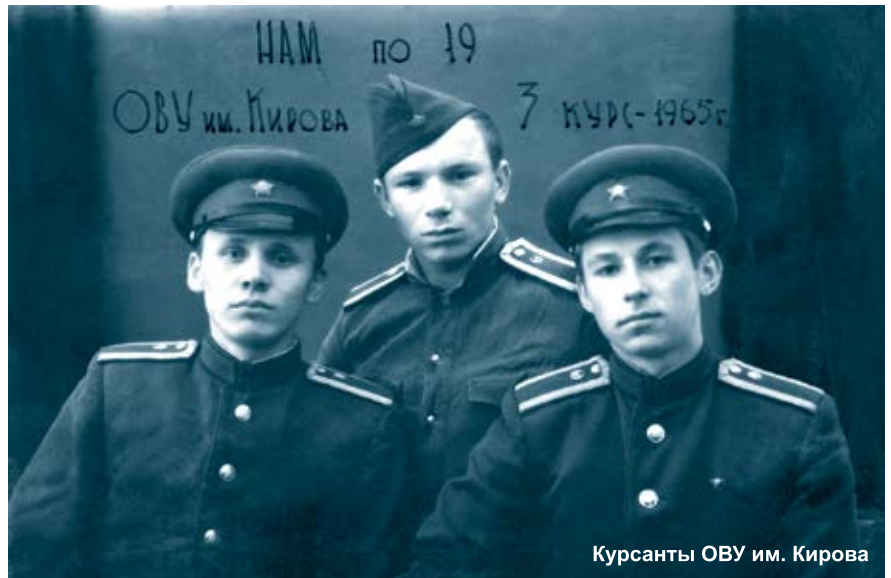
Курсанты ОВУ им. Кирова

который стал мне очень близок. Петр Аркадьевич был честным и порядочным человеком. Оказывается, ее дядя приехал по приглашению Столыпина для изучения сельскохозяйственной реформы. И в основе этой реформы была не барская чересполосица, которая осталась от крепостного права, а хуторская система. И когда я прочел эту книгу, то убедился, насколько был грандиозен план Столыпина по реформированию сельского хозяйства России.