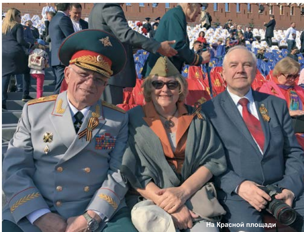
На Красной площади

– А что такое гражданская война? Это не разрешенные властью противоречия. Поэтому сегодня создавать условия для разрешенных властью противоречий – это значит привести общество к гражданской войне и вывести людей на улицу. Это надо предвидеть и не допустить, и мы открыто об этом говорим. Наша задача – исполь-