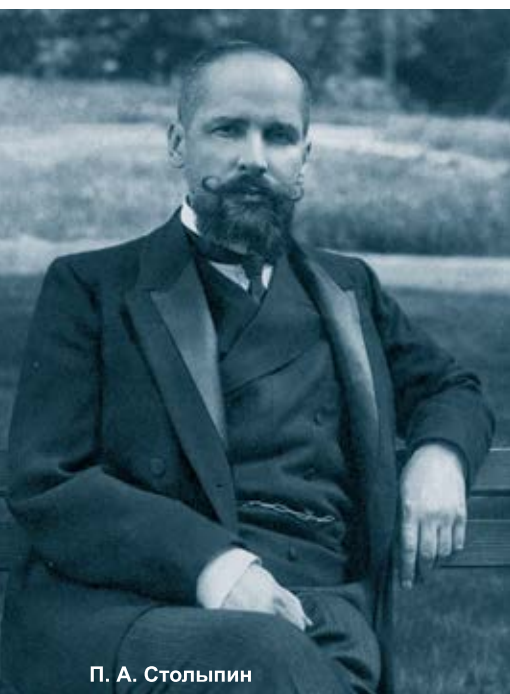
П. А. Столыпин