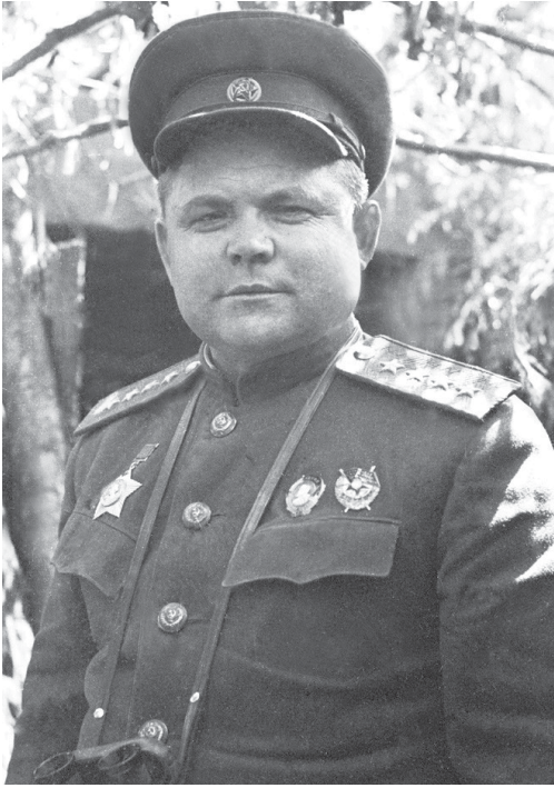
Герой Советского Союза генерал армии Николай Фёдорович Вагутин, командующий 1-м Украинским фронтом