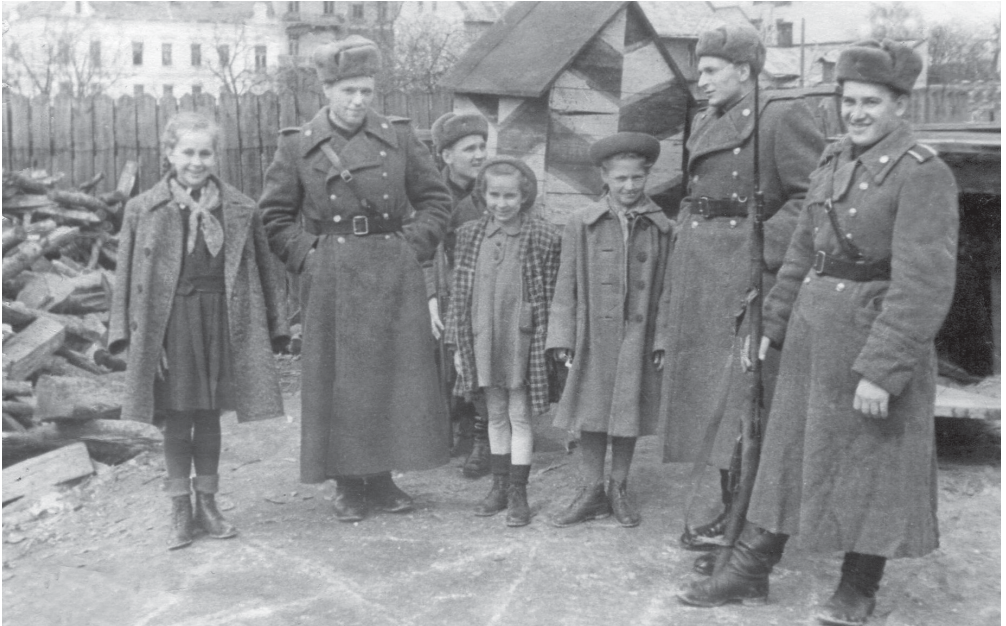
Курсанты Львовского военно-политического училища несут службу по обеспечению выборов в Верховный Совет СССР. Львов, 12 марта 1950 г.