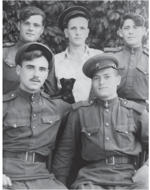
Военнослужащие внутренних войск