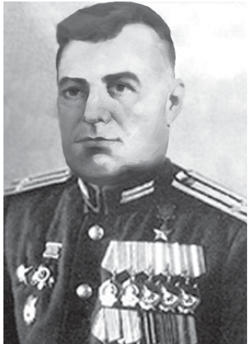
Герой Советского Союза подполковник Фёдор Иванович Чичкан