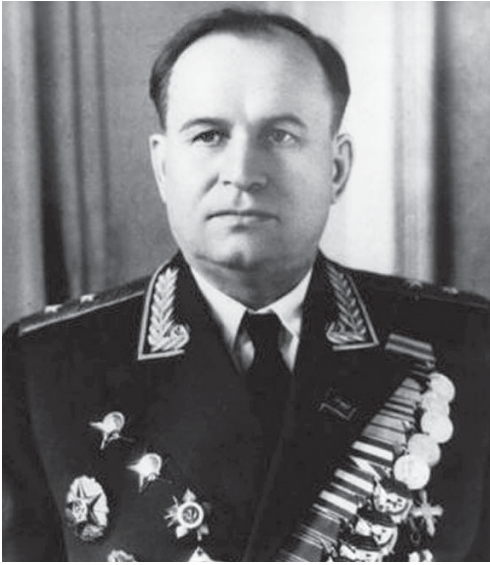
Генерал-лейтенант Тимофей Амвросиевич Строкач, народный комиссар (министр) внутренних дел Украинской ССР в 1946–1953 гг.