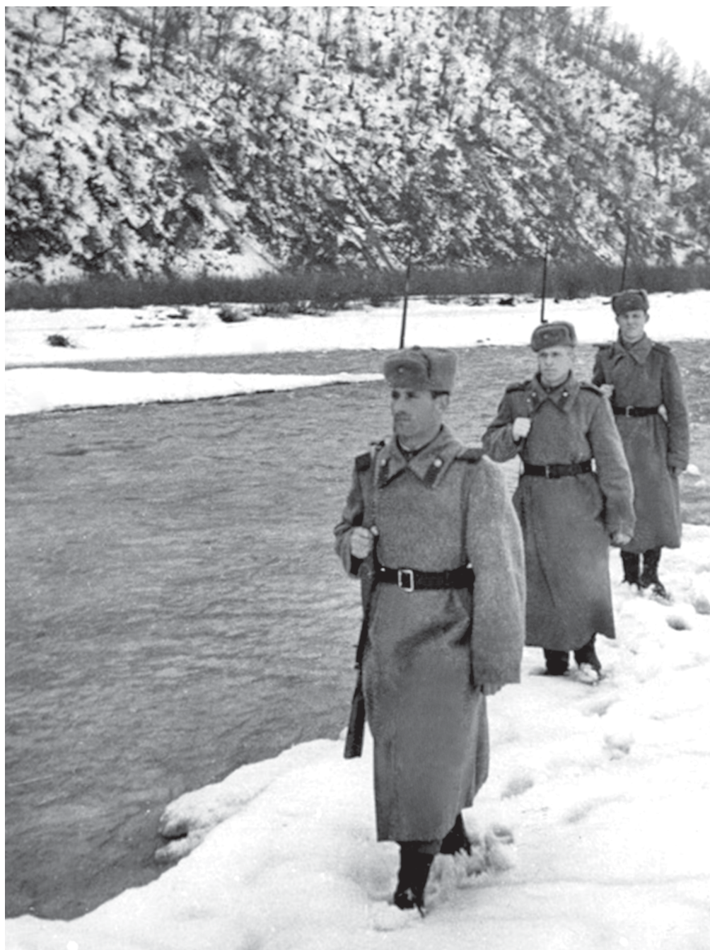
Пограничники в Карпатах, февраль 1946 г.