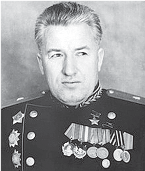
Герой Советского Союза генерал-майор Александр Николаевич Сабуров. В 1944-1951 гг. – начальник Управления НКВД (МВД) по Дрогобычской области, организатор борьбы с украинскими националистами