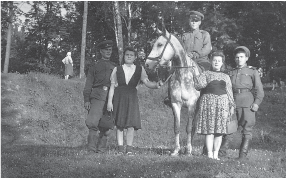
Военнослужащие внутренних войск с местными жительницами