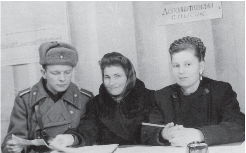
На избирательном участке все спокойно. Выборы в Верховный Совет СССР. Львов, 12 марта 1950 г.