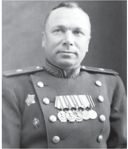
Генерал-лейтенант Илья Иванович Демшин, с августа 1944 г. по март 1948 г. – начальник пограничных войск Закарпатского округа НКВД–МВД СССР