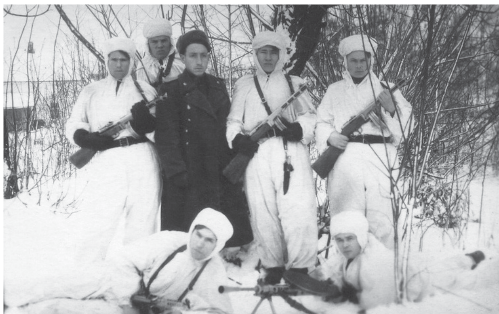
Разведывательно-поисковая группа (РПГ) внутренних войск