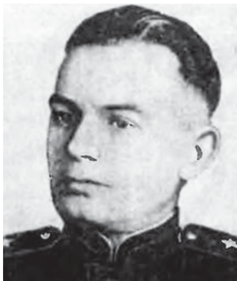
Генерал-лейтенант Пётр Никифорович Мироненко, начальник Политуправления Главного управления погранвойск НКВД-МВД СССР. С марта 1948 г. по август 1950 г. – начальник пограничных войск Закарпатского округа НКВД-МВД СССР