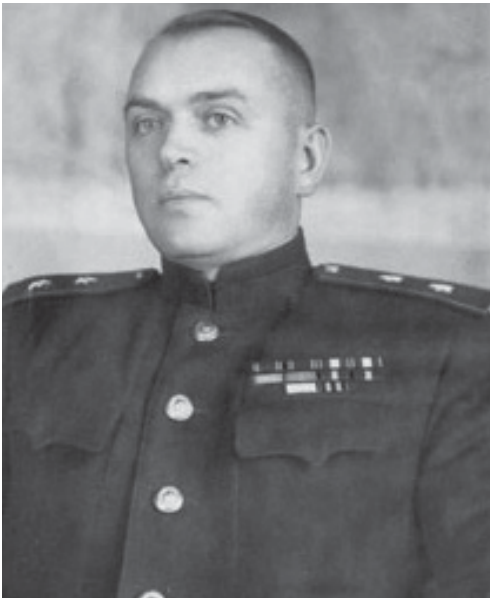
Генерал-лейтенант Николай Кузьмич Ковальчук, министр государственной безопасности Украинской ССР