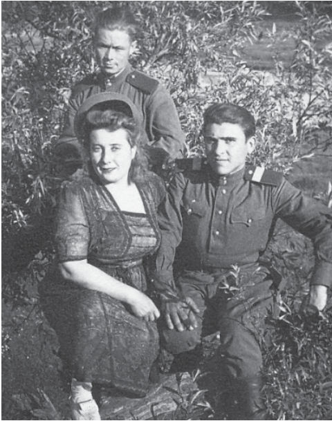
Фотография на память с местной жительницей