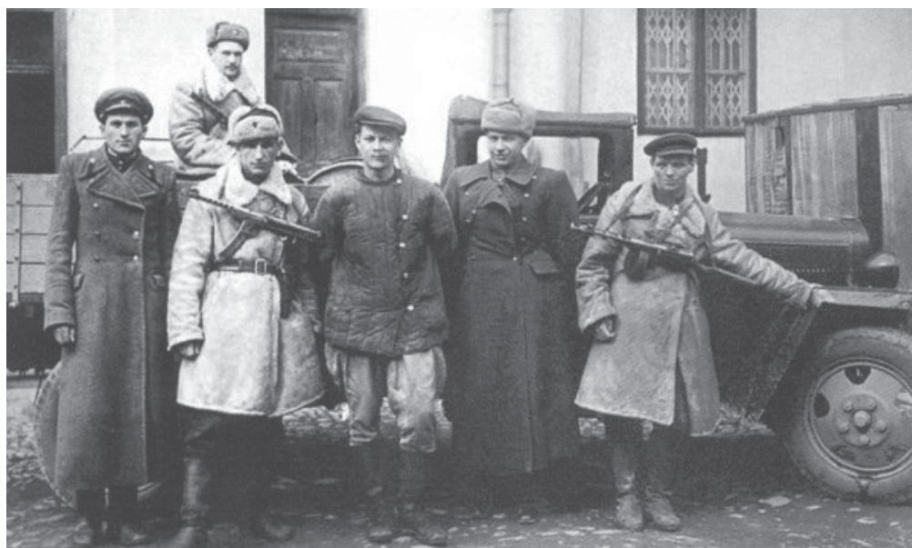
Оперсостав МГБ УССР после чекистско-войсковой операции. Дрогобыч, 1950 г.