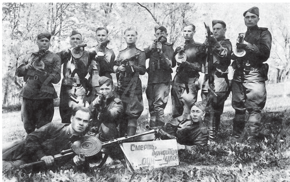
Участники борьбы с бандподпольем на Западной Украине