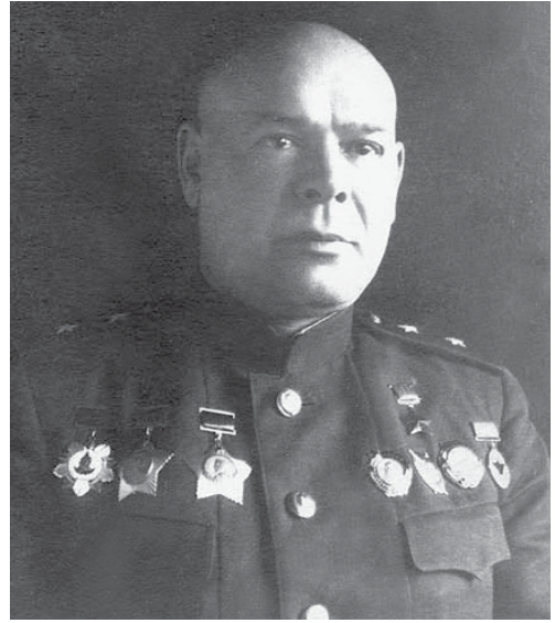
Герой Советского Союза генерал-лейтенант Николай Павлович Пухов, командующий 13-й армией