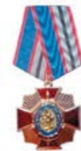
Орден Советов ветеранов ЦА МВД России «За благородство помыслов и дел»