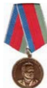
Медаль М. А. Шолохова за гуманизм и служение России