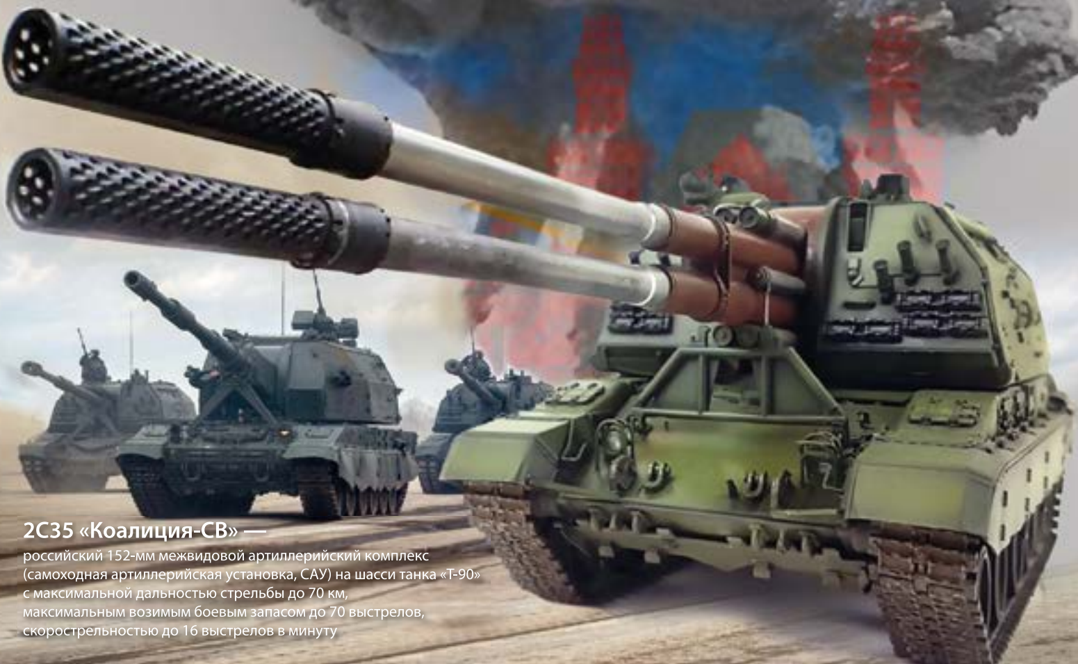
2С35 «Коалиция-СВ» — русский 152-мм межвидовой артиллерийский комплекс (самоходная артиллерийская установка, САУ) на шасси танка «Т-90» с максимальной дальностью стрельбы до 70 км, максимальным возимым боевым запасом до 70 выстрелов, скорострельностью до 16 выстрелов в минуту