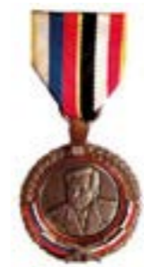
Медаль М.Т. Калашников