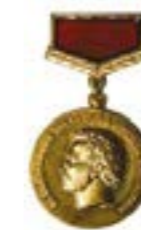
Золотая медаль А. С. Пушкина за сохранение традиций в русской литературе

Журнал «Честь имею» распространяется на территории РФ, Абхазии, Южной Осетии, Белоруссии, Армении, Кыргызстана и Центральной Азии, Израиля