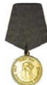
Медаль Л. Н. Толстого за воспитание, обучение, просвещение